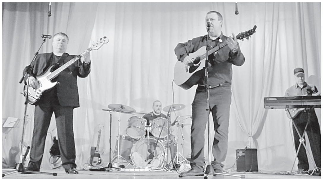
Выступает группа «Номинал»